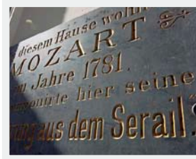
Mozart sävelsi Webereillä oopperan.

Noihin aikoihin Mozart myös sävelsi kepeän oopperansa Ryöstö Seraljista . Se kertoo Belmontesta, joka haluaa vapauttaa rakastettunsa Konstanzen vankeudesta turkkilaisesta palatsista. Teoksesta tuli suuri menestys, ja köyhtynyt säveltäjä ansaitsi sillä niin paljon rahaa, että hän pystyi viemään Constanzensa vihille.