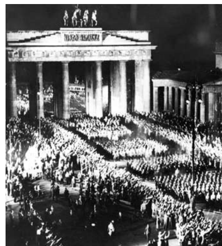
Hitler nousi valtaan 30. tammikuuta 1933. Tapahtumaa juhlistanut soitukulkue lähti Brandenburgin portilta.

tista Wilhelmstrassea pitkin kohti valtakunnankansliaa, Hitlerin uutta virka-asuntoa ja päämajaa. Myöhemmin Albert Speer suunnitteli Hitlerin pyynnöstä uuden valtakunnankanslian, koska tämä piti vanhaa liian vaatimattomana. Molemmat kansliat vaurioituivat pahasti puna-armeijan pommituksissa Berliinin valtauksen aikana vuonna 1945.