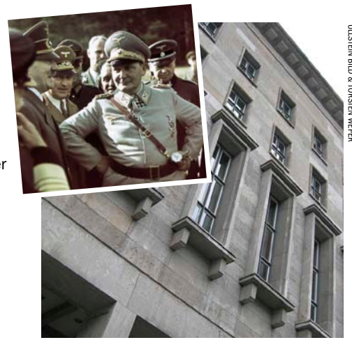
Näiden ikkunoiden takana Göring johti Saksan Luftwaffe. Nykyään rakennuksessa on valtiovarainministeriö.