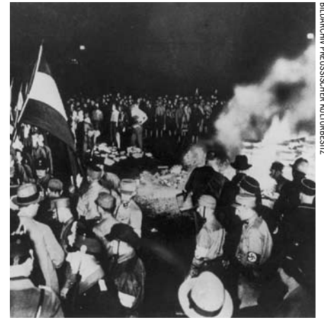
BILDARCHIV PREUSSISCHER KULTURBESITZ