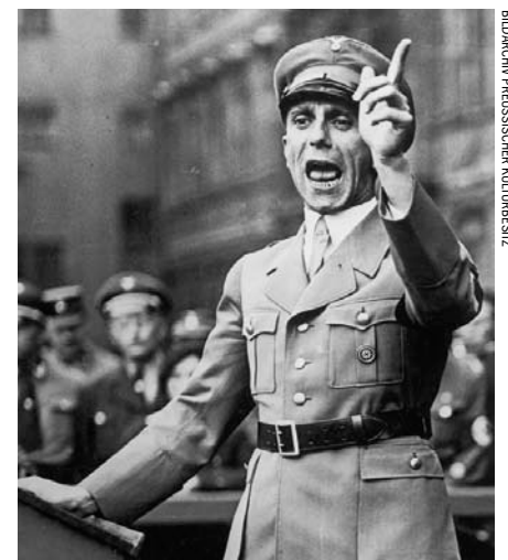
Hitler nimitti Goebbelsin seuraajakseen, mutta tämä teki itsemurhan heti Hitlerin kuoleman jälkeen.