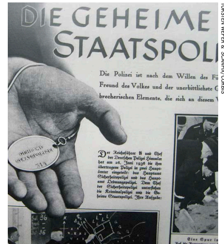
Gestapon päämajan raunioille pystytetty näyttely kertoo natsien hirmutöistä